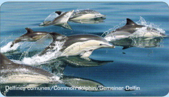
Delfines comunes/Common dolphin/Gemeiner Delfin