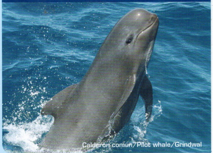
Calderon comun/Pilot whale/Grindwal