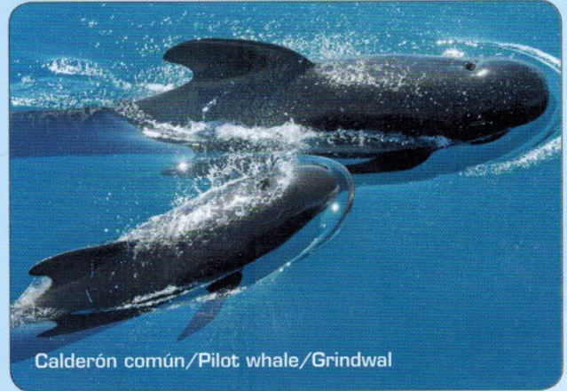
Calderón común / Pilot whale / Grindwal