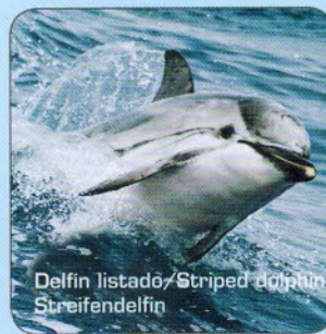
Delfin listado / Striped dolphin Streifendelfin